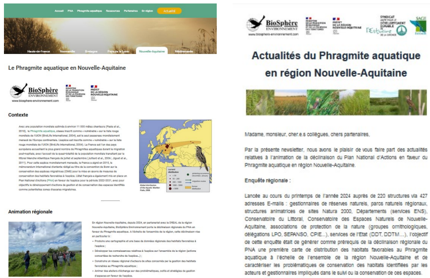
Figure 4 : outils de communication mis en place dans le cadre de l'animation de la déclinaison régionale du PNA en faveur du Phragmite aquatique en région Nouvelle-Aquitaine : gauche : page web hébergée sur le site national du PNA ; droite : newsletter.

Afin de communiquer sur les actions à mener en concertation avec l'ensemble des acteurs de la région Nouvelle-Aquitaine concernés par la conservation des habitats favorables au Phragmite aquatique, et de communiquer sur l'état d'avancement de ces actions : résultats, données collectées... différents outils de communication ont été mis en place, avec en particulier une page internet dédiée à la déclinaison régionale du PNA en faveur de l'espèce hébergée sur le site du PNA ( https://pna-phragmite-aquatique.org/nouvelle_aquitaine ), ainsi qu'une newsletter : 3 éditions au cours de l'année 2024 (figure 4).