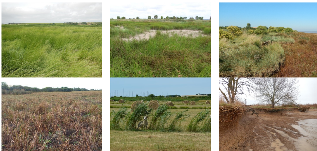
Figure 3 : exemples de problématiques de conservation des habitats favorables au Phragmite aquatique mises en évidence sur les sites identifiés comme favorable à l'espèce en région Nouvelle-Aquitaine : de gauche à droite et de la ligne du haut vers la ligne du bas : atterrissement, assèchement en période estivale, prolifération d'espèces végétales exotiques envahissantes ( Baccharis halimifolia ), fauche en période estivale, érosion des zones humides intertidales.